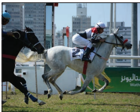
Fada HVP ganha a primeira prova do festival

O tempo de Fada HVP para o quilômetro foi 1'06"392.