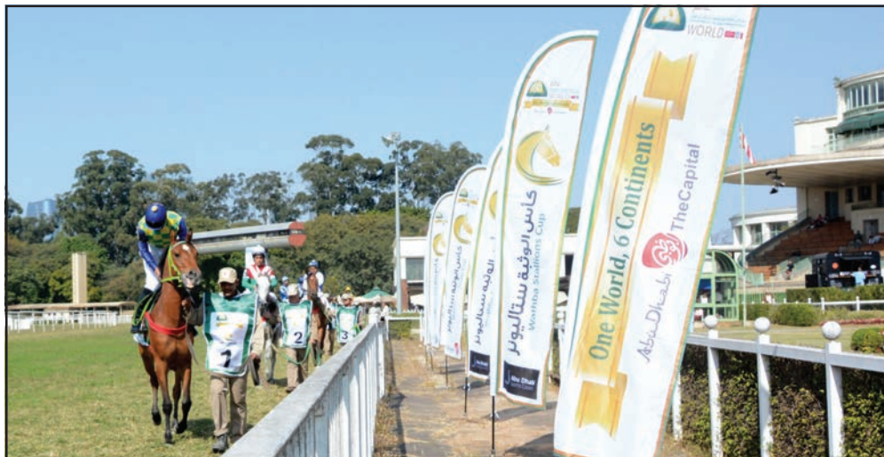
Cavalos entrando na raia paulista

“Sem dúvida hoje (sábado) é um dia histórico para os cavalos árabes de corrida no Brasil. Nesses quatro anos e meio, conseguimos fazer um festival de